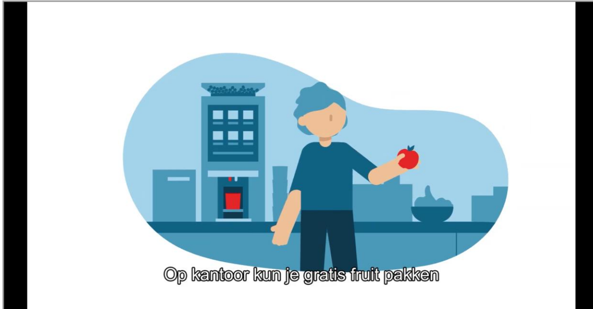
Video over de arbeidsvoorwaarden van gemeente

3. Eén gemeente noemt de arbeidsvoorwaarde pensioen niet in zijn vacature. Zowel in hun wervingsteksten als op de pagina [Arbeidsvoorwaarden] komt het woord pensioen niet voor . Alleen in de video over de arbeidsvoorwaarden wordt aan het einde van het filmpje genoemd; '(oh ja*) u krijgt ook een goed pensioen' (zucht*).