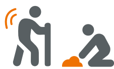
Kwetsbare positie van arbeiders